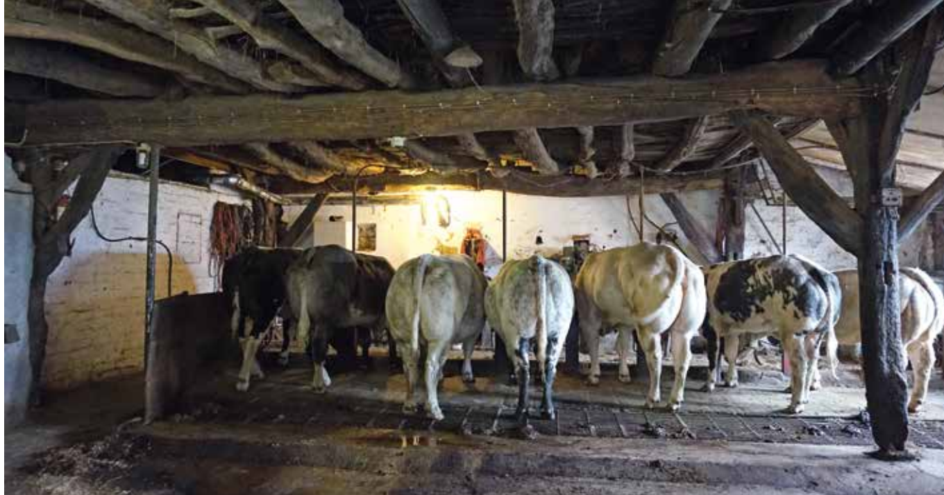
De stal met de gebinten 4 en 3 in beeld.

verlenging van de stal met dat toegevoegde gebint moet dus al vóór 1784 hebben plaatsgehad.