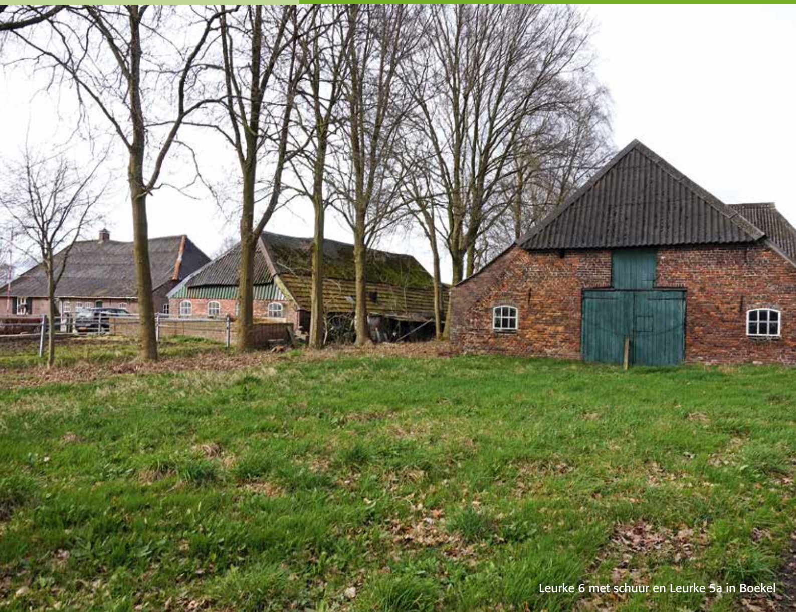
Leurke 6 met schuur en Leurke 5a in Boekel

SdBb brabantse boerderijen, bijgebouwen, erf en cultuurlandschap.