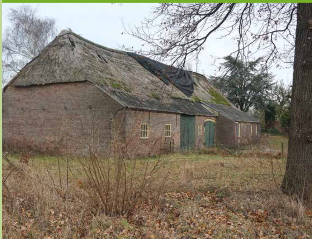
Leegstand leidt tot verwaarlozing. Wolfskamp 1, Milheeze

Stichting de Brabantse Boerderij zoekt Vrienden. Vanaf €22,- per jaar bent u Vriend van onze Stichting. U ontvangt daarvoor onze Nieuwsbrief met wetenswaardigheden over Brabantse boerderijen, bijgebouwen, erf en cultuurlandschap en aankondigingen van onze activiteiten. Ook krijgt u korting op onze publicaties en cursussen en u kunt deelnemen aan onze jaarlijkse Vriendendag. Maar vooral steunt u als Vriend het werk van SdBB.