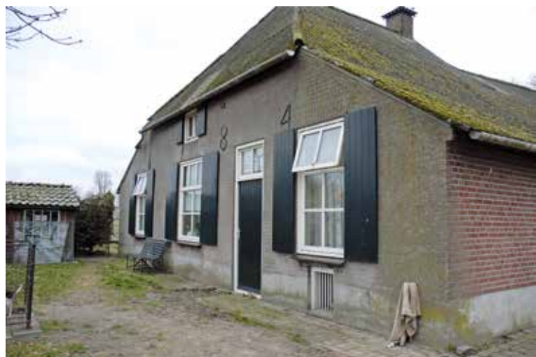
De westelijke dwarsgevel van Leurke 6 met muurankers 1784.