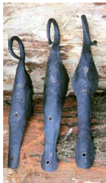
Nieuw gesmede schepshaken (smid Eefke Dings); (foto Ruud van Nooijen)

De waterspiegel in een waterput bevindt zich normaal een paar meter onder de rand van de put. Om water uit de put op te halen werd er meestal een putstel naast de put gezet. Het putstel bestaat uit drie onderdelen: de putmik, de putzwengel en de puthaak. De putmik was meestal een ingegraven boomstam met aan het takkeinde een natuurlijke vork of gaffel. Voor de zwengel werd een wat lichtere onderstam gebruikt en tenslotte de puthaak waarvoor een gladde dunne stam werd uitgezocht. Deze puthaak werd scharnierend opgehangen aan de putzwengel om de puttemmer te dragen en om de emmer verticaal in de put