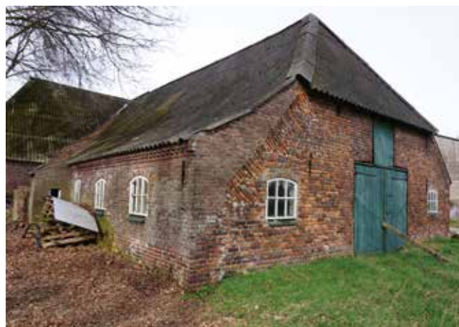
Achtergevel Leurke 5a

Het oude hallenhuis is in de loop van de 18de eeuw voorzien van bakstenen gevels. De complete zuidelijke dwarsgevel aan de stalzijde resteert daarvan. Aan de westkant ruim voorzien van vlechtingen. In het midden dubbele potstaldeuren met daarboven een hooiluik. Ook in de noordelijke dwarsgevel (voorgevel