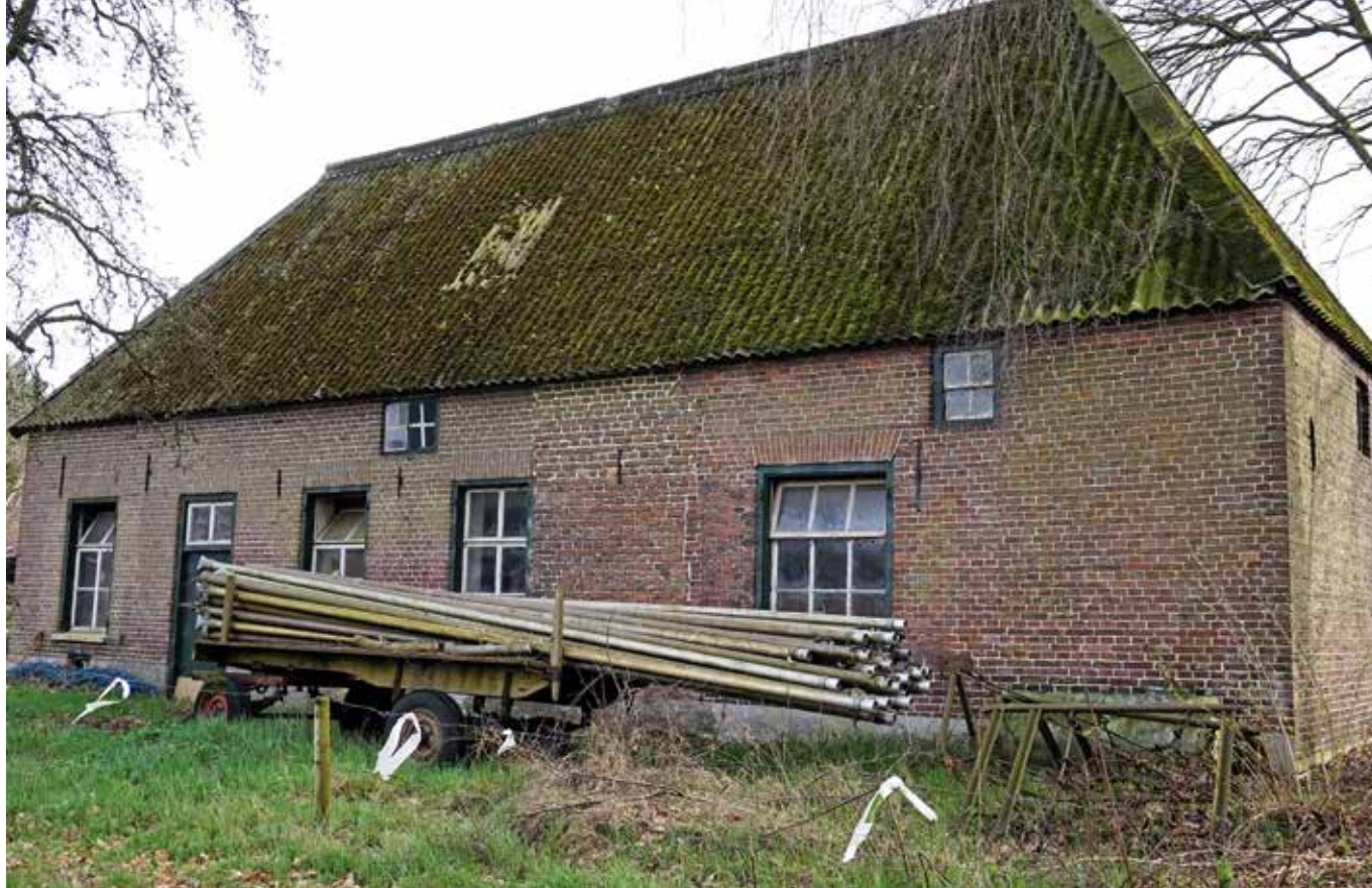
Voorgevel Leurke 5a