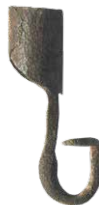
Oude puthaak; (foto Ger van den Oetelaar)

De "haak"-benaming komt waarschijnlijk van de ijzeren haak, die onderaan de puthaak is bevestigd. Naam en functie zijn samengetrokken, hoewel ook deze haak heeft plaatselijk verschillende benamingen. In Oirschot sprak men van een schephaak, evenals in Nijnsel en in Sint-Oedenrode sprak men weer van een puthaak. Deze schepshaken kwamen in vele vormen voor. De haken op bijgaande afbeeldingen hebben min of meer de vorm van een varkensstaart. De krulvorm voorkomt dat de emmer van de haak valt. De gesmede exemplaren werden meestal op bestelling geleverd