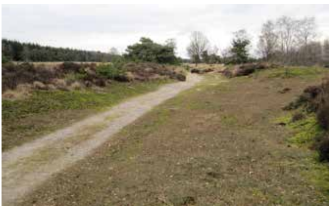
Een prehistorische weg in Milheeze

Maar zonder specifieke erkenning van het belang van dit erfgoed en speciale aandacht en ondersteuning ervan, dreigt dit erfgoed langzamerhand te verwateren of te verdwijnen. Zo kan een mooi Brabants landschap aangetast worden door het – vaak minder doordacht – aanleggen van een weg of het plannen van een industrieterrein. Vooruitgang op deze vlakken is onvermijdelijk, maar vaak kan een oplossing gekozen worden die voor het landelijk erfgoed minder ingrijpend is. Ook de aanleg van (nieuwe) natuur gaat regelmatig ten koste van het landschap en het landelijk erfgoed.