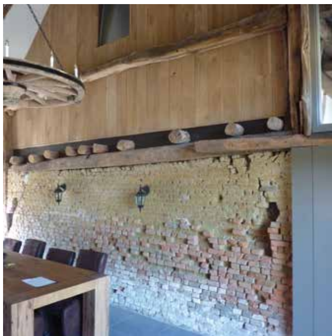
De boerderijenpluim 2017 ging naar Best.

In september / oktober zal de jury de genomineerde boerderijen bezoeken. In november 2019 wordt "De Pluim" uitgereikt.