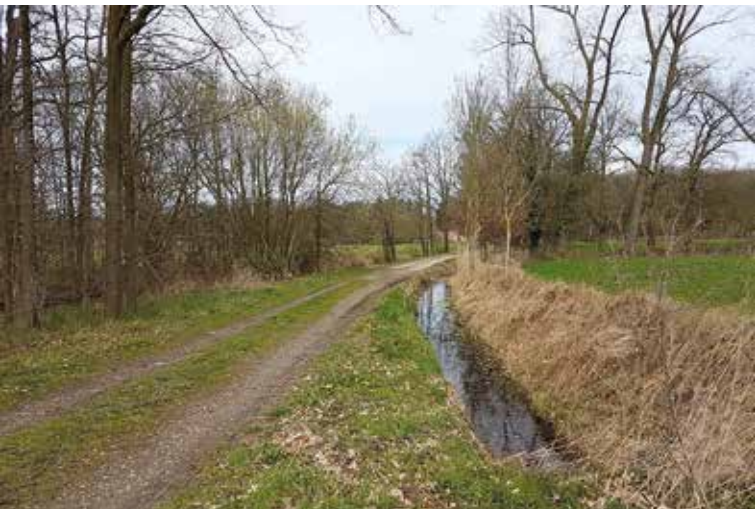
De Mortelen