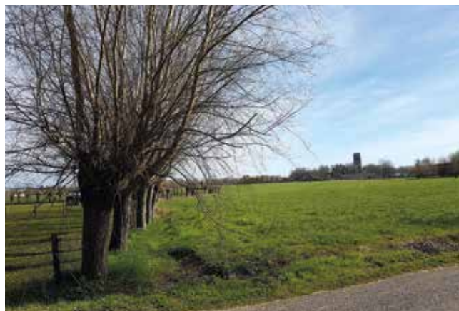
Gezicht op Oirschot.

Met de campagne benadrukken we de Brabantse identiteit en maken wij de inwoners van Brabant bewust van de rijke Brabantse geschiedenis. Het Hertogdom Brabant, dat zich uitstrekte van Zoutleeuw tot Zevenbergen en van Nijvel tot Den Bosch, met Brussel als hoofdstad, heeft in de geschiedenis van Europa en van de Nederlanden een belangrijke rol gespeeld. Een rol die de laatste jaren veelal onderbelicht blijft. Wij willen dat de provincie er naar streeft dat iedere inwoner van de provincie zich van deze historie bewust is.