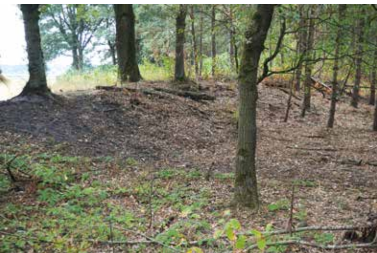
Middeleeuwse wal rondom Moorsel, Lierop

https://www.debrabantseboerderij.nl/images/Nieuws/Manifest-Brabants-landelijk-Erfgoed.pdf