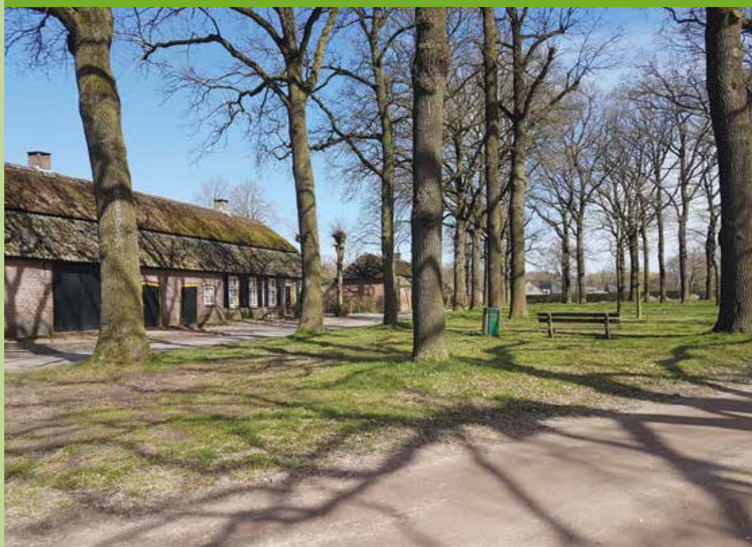
Beschermd dorpsgezicht Loon

Stichting de Brabantse Boerderij zoekt Vrienden. Vanaf € 22,- per jaar bent u Vriend van onze Stichting. U ontvangt daarvoor onze Nieuwsbrief met wetenswaardigheden over Brabantse boerderijen, bijgebouwen, erf en cultuurlandschap en aankondigingen van onze activiteiten. Ook krijgt u korting op onze publicaties en cursussen en u kunt deelnemen aan onze jaarlijkse Vriendendag. Maar vooral steunt u als Vriend het werk van SdBb.