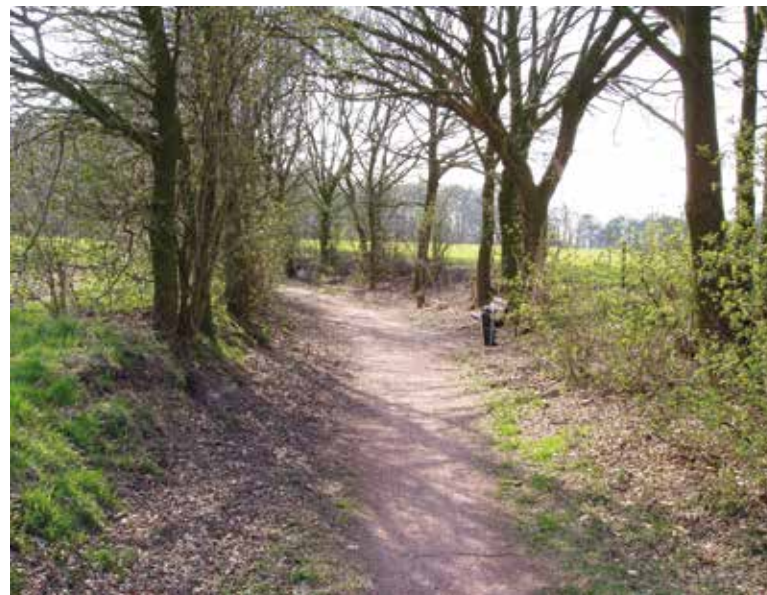
Een holle weg in Bakel

Het gebouwde erfgoed kent verschillende aspecten. Niet alleen is het gebouw van belang – dat is de essentie – maar ook het interieur, de omgeving, het gebruik, het historisch bewustzijn en het verhaal (zie de bijlage). Al deze aspecten dragen bij aan de cultuurhistorische waarde van het erfgoed: wanneer één van deze aspecten wordt aangetast, gaat dit ten koste van de waarde van het erfgoed als geheel. Zo is de omgeving van bijvoorbeeld een molen of een buitenplaats – de zogenaamde biotoop van het monument – van groot belang voor de erfgoedwaarde ervan. Een flatgebouw naast een molen betekent niet alleen dat deze niet meer kan functioneren – de wind wordt immers weggenomen – maar ook dat de monumentale erfgoedwaarde ervan wordt aangetast. Een buitenplaats met een spoorlijn door het oorspronkelijke park, verliest daarmee een groot deel van zijn erfgoedwaarde.