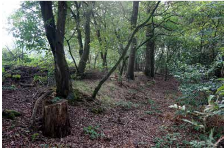
Middeleeuwse wal om de oude ontginning Slabroek, Nistelrode

Ook al zullen velen het belang van erfgoed erkennen, het erfgoed – en met name het landelijk erfgoed – wordt bedreigd. Te gemakkelijk worden besluiten genomen die ten koste gaan van landelijk erfgoed. Zo wordt vaak achteloos bebouwing gepland ten koste van het dit erfgoed. Erfgoed heeft vaak een hoge eco-