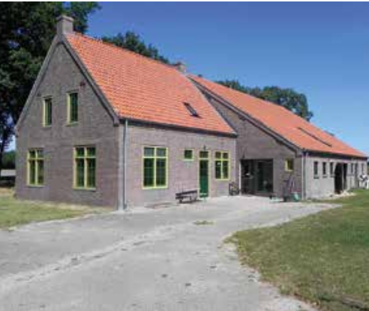
De Hertheuvelsehoef in Eersel

SdBB organiseert weer een boerderijbezoek. Deze keer gaat het om een eenmalig bezoek aan de gerestaureerde Hertheuvelsehoef in Eersel. De Hertheuvelsehoef is in 1938 in opdracht van de Paters Norbertijnen uit Postel gebouwd op de plek waar de Abdij van Averbode al zeker vanaf het midden van de zeventiende eeuw een 'goed' had dat destijds Heijnsheuvel heette. De boerderij is samen met de naastgelegen boerderij (die gesloopt is) door een onbekende architect ontworpen. Waarschijnlijk is door de oorlog het gebouw pas in dienstjaar 1946 door het kaster opgetekend.