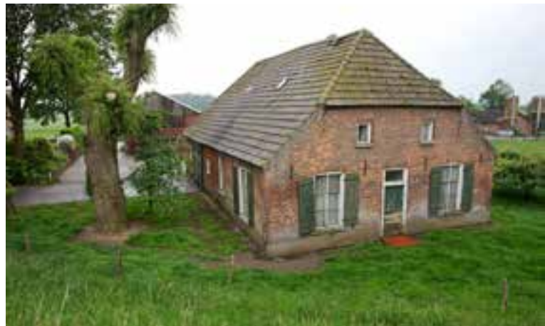
Maasdijk 63, Neerlangel, gezien vanaf de Maasdijk.

Gezien het algemene ontwikkelingsbeeld van boerderijen, zoals hiervoor geschetst, mag je verwachten dat een boerderij met de vorm van een hallehuis ouder is dan de gemiddelde langgevelboerderij en dat in het inwendige van zo'n pand de ankerbalkgebinten nog (deels) aanwezig zijn. Dat is dan ook de gedachte bij het zien van de boerderij Maasdijk 63 in Neerlangel. De vorm en de afmetingen van de boerderij komen overeen met de meest voorkomende hallehuizen. Het is een combinatie van woning en stal, zonder een aangebouwd schuurgedeelte. Vergelijken we deze boerderij met soortgelijke boerderijen op de zandgronden dan zouden we snel de conclusie trekken dat het hier zou gaan om een gebouw van minstens de 18de eeuw. Dat blijkt echter niet het geval.