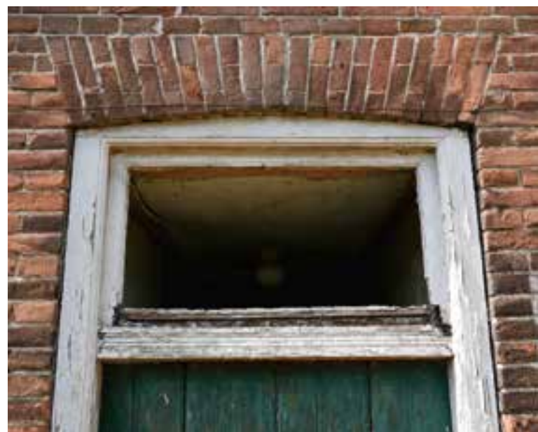
Detail rondom het bovenlicht van de voordeur.

Het hallehuis in Neerlangel blijkt in 1883 gebouwd te zijn. In die tijd was het verder naar het zuiden gebruikelijk om langgevelboerderijen te bouwen. De boerderij aan de Maasdijk heeft ook meerdere elementen die we van langgevelboerderijen kennen. Maar het is bijzonder opvallend dat men bij de bouw van de boerderij gekozen heeft voor de vorm van een hallehuis. Kennelijk is de traditie aan de Maaskant om boerderijen te bouwen met de vorm van een hallehuis langer aanwezig gebleven dan op de zuidelijke zandgronden. Aan de andere kant blijkt uit de 'moderne' elementen dat men wel degelijk innovatief was. In contrast hiermee is het aardig te melden dat nog in 1861 in Uden een compleet nieuwe kortgevelboerderij werd gebouwd op basis van ankerbalkgebinten. In Uden was dus zo'n 20 jaar eerder blijkbaar nog niets doorgedrongen van een moderne langgevelboerderij.