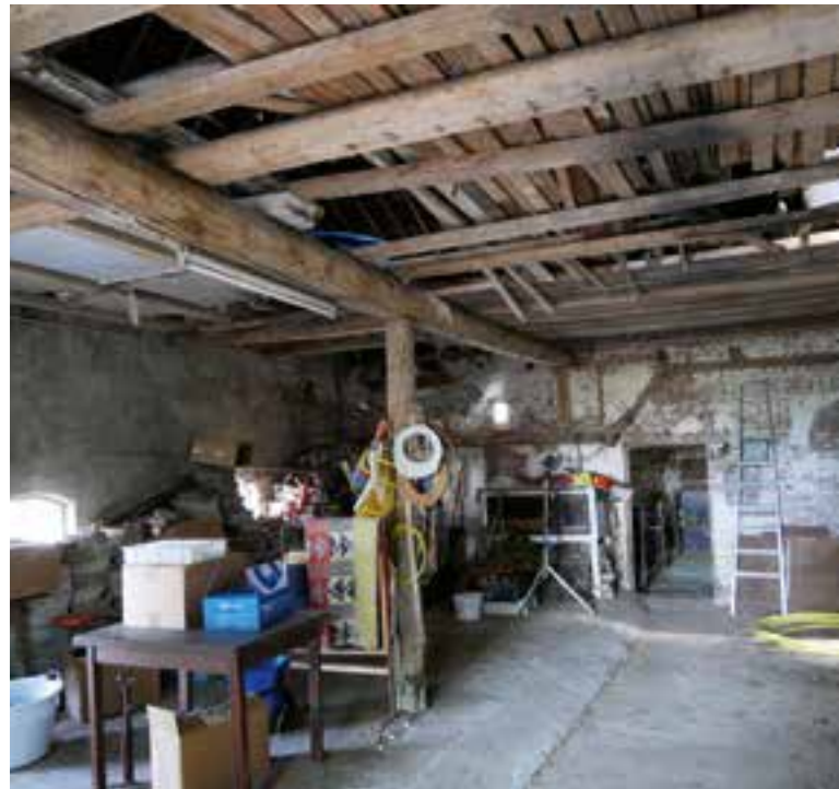
Het stalgedeelte van Maasdijk 63. Op de achtergrond de voormalige buitengevel met een doorgang naar de aanbouw. De zolderbalk rust op een console.

Het eerste kaartje is van dienstjaar 1846. In het jaar daarvoor is op het betreffende perceel een boerderij gebouwd op nagenoeg dezelfde plaats als waar nu Maasdijk 63 staat. De boerderij heeft geen lang leven gekend, want in dienstjaar 1884 is een kaartje getekend waaruit blijkt dat de boerderij op nagenoeg dezelfde plaats is herbouwd. Het bestond toen uit een rechthoekig oppervlak. De boerderij die we nu kennen, maar nog zonder aanbouw. Die aanbouw is gerealiseerd in 1903, wat uit het derde kaartje blijkt.