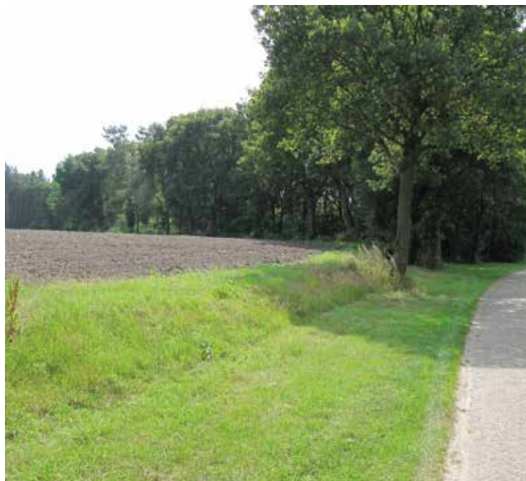
Een bolle akker met steilrand in Lierop.

De hoge steilranden en de oude akkerwallen waren begroeid