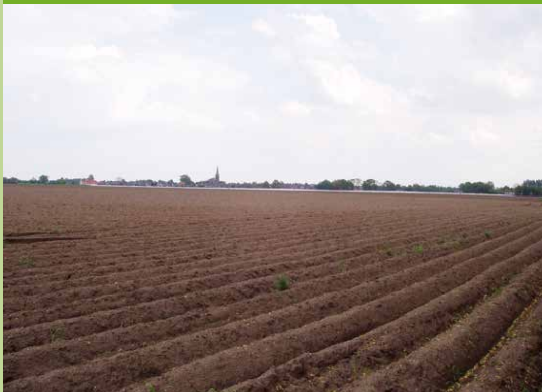
De Hoge Kranebraken met op de achtergrond de kerk van De Mortel.

Stichting de Brabantse Boerderij zoekt Vrienden. Vanaf € 22,- per jaar bent u Vriend van onze Stichting. U ontvangt daarvoor onze Nieuwsbrief met wetenswaardigheden over Brabantse boerderijen, bijgebouwen, erf en cultuurlandschap en aankondigingen van onze activiteiten. Ook krijgt u korting op onze publicaties en cursussen en u kunt deelnemen aan onze jaarlijkse Vriendendag. Maar vooral steunt u als Vriend het werk van SdBb.