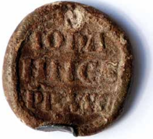
Een voorbeeld van een religieus 'offer': een loden zegel van een oorkonde van paus Johannes XXII uit 1316-1334, aangetroffen op de Boerse Strepen in Gemert..