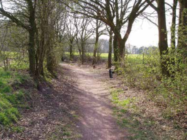
De nog bestaande holle weg in Bakel. Verderop is het hoogteverschil nog een stuk groter.