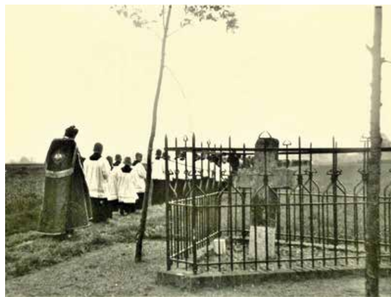
Een processie bij het Hagelkruis van Aarle-Rixtel tijdens de kruisdagen.