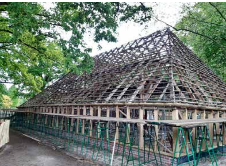
De schuur vóór en tijdens de wederopbouw.